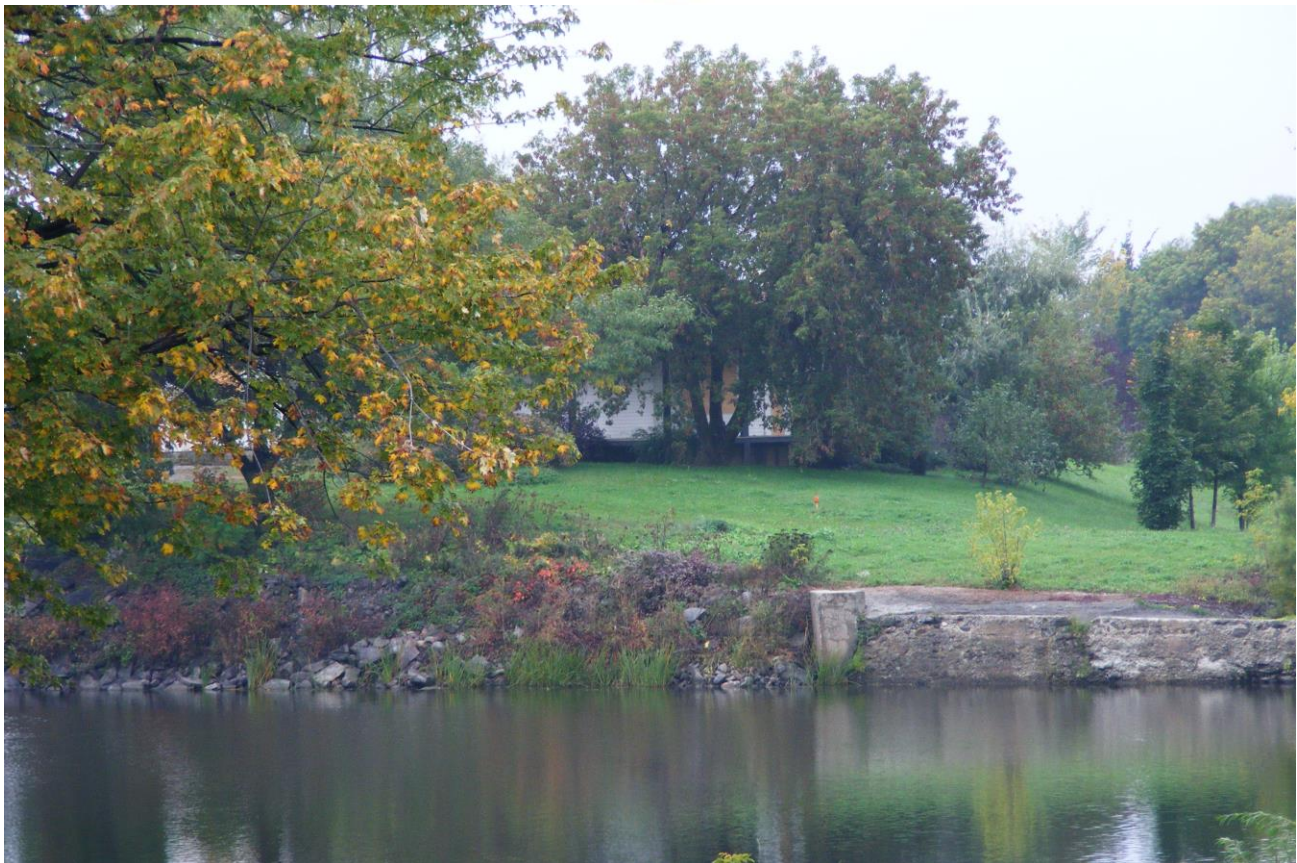
La rivière Châteauguay au Parc Gaétan Montpetit à Sainte-Martine