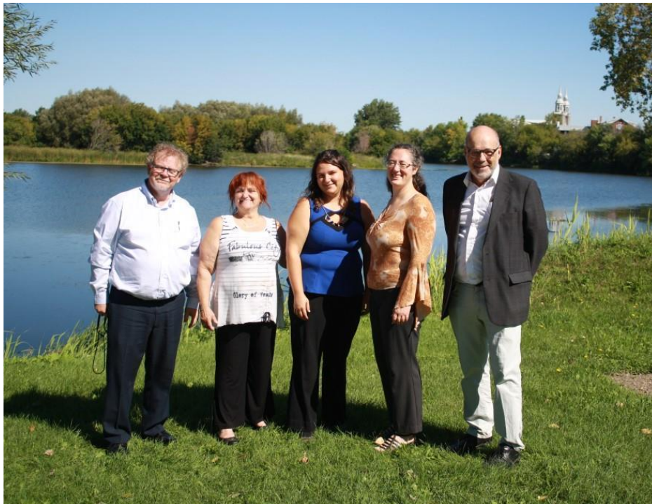
L'équipe de la SCABRIC avec son président devant la rivière Châteauguay à Sainte-Martine