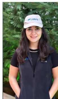
L'équipe de l'OBV SCABRIC